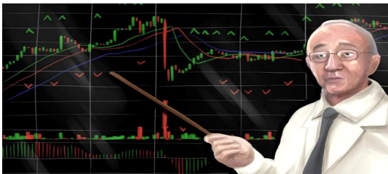
دکتر بیل ویلیامز